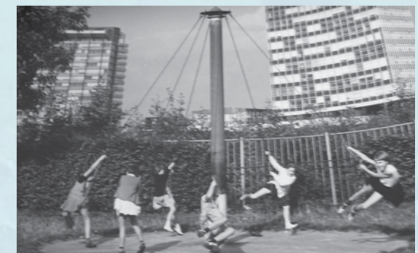
Zwieren aan een speeltoestel in een ver verleden

Wilt u deze aflevering van Andere Tijden nog een keer bekijken ga dan naar: www.uitzendinggemist.nl (uitzendingdatum 14-10-2010) ■