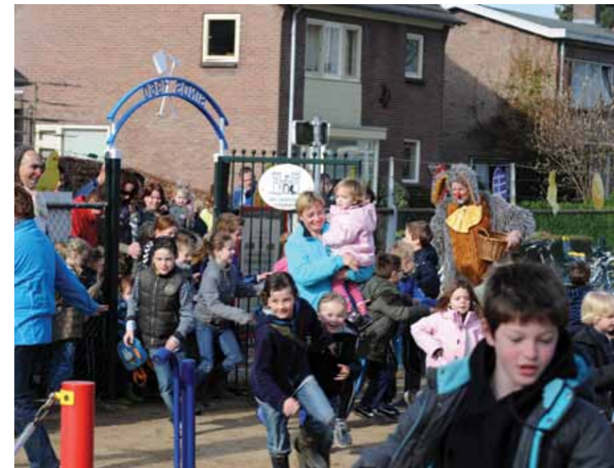
Jeugd verdringt zich om de speeltuin binnen te komen tijdens een activiteit