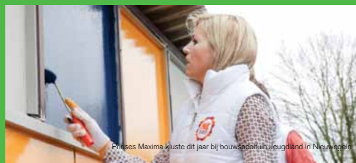
Prinses Maxima kluste dit jaar bij bouwSpeeltuin Jeugdland in Nieuwegein