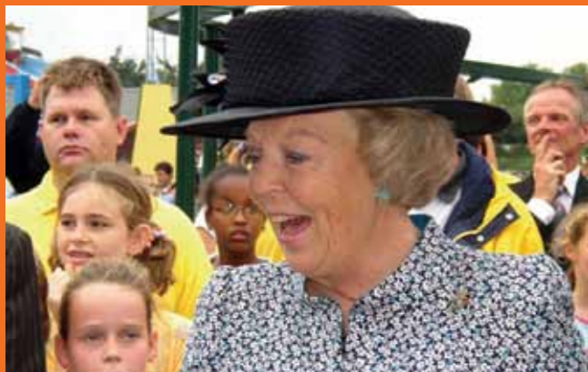
De koningin genoot duidelijk tijdens haar bezoek aan het NUSO-feest in 2006

De NUSO bestaat in 2011 tachtig jaar en wil dat met alle leden vieren op zaterdag 10 september. Waar is nog niet bekend.