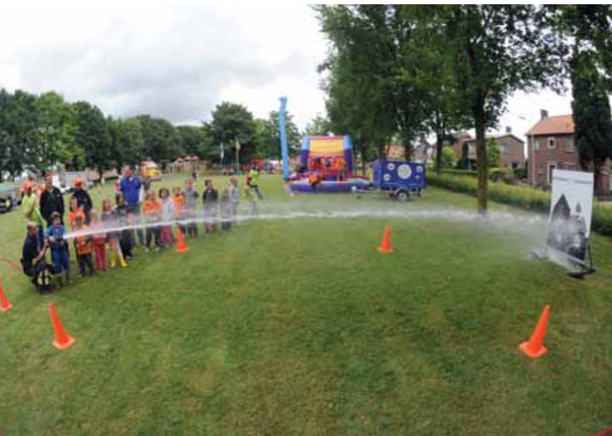
Met een echte brandweerspuit aan de gang