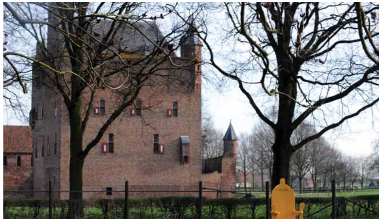
Kasteel Doornenburg bij de speeltuin