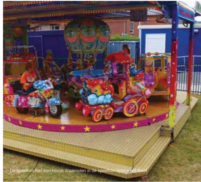
De speeltuin had een heuse draaimolen in de speeltuin tijdens het feest