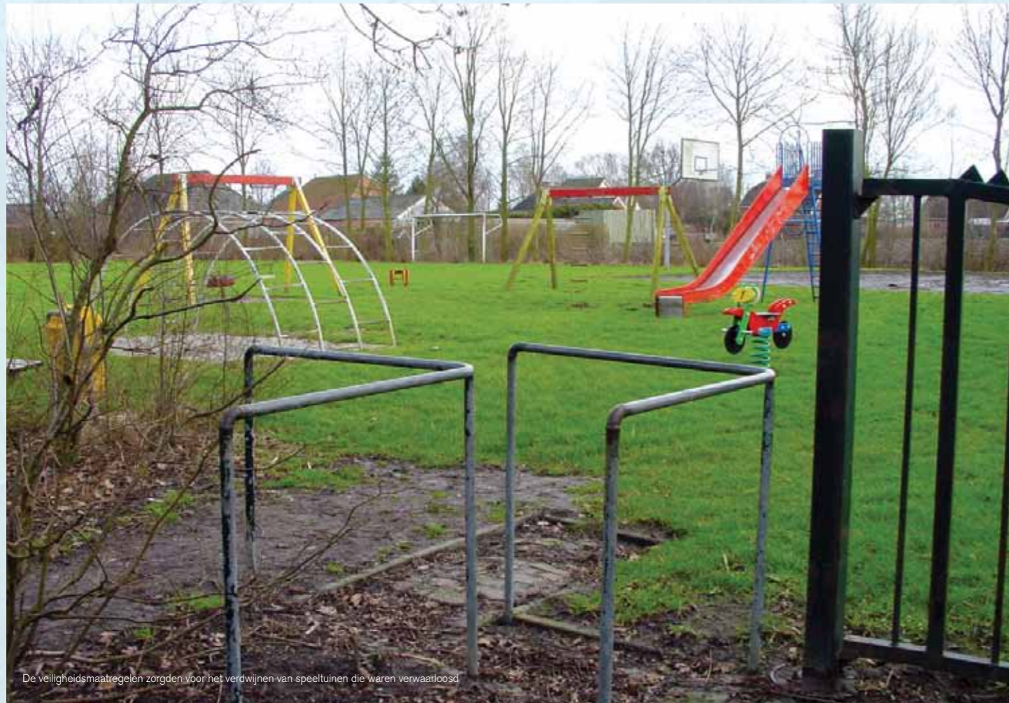
De veiligheidsmaatregelen zorgden voor het verdwijnen van speeltuinen die waren verwaarloosd